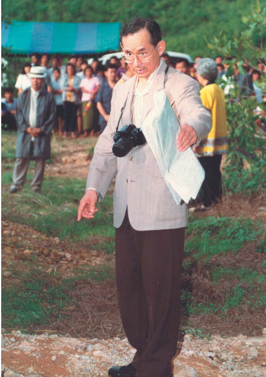
หลักการทรมาน ๒๕