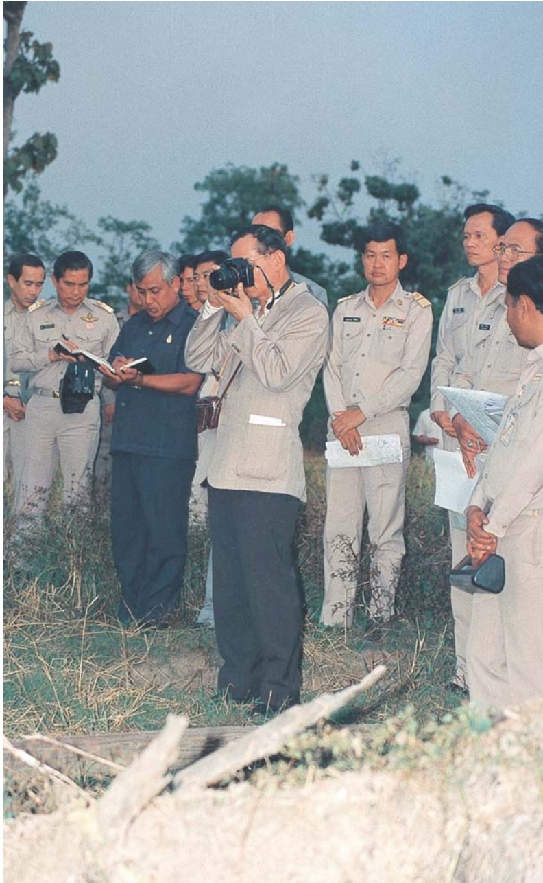
หลักการณ์รบบาน ๑๗