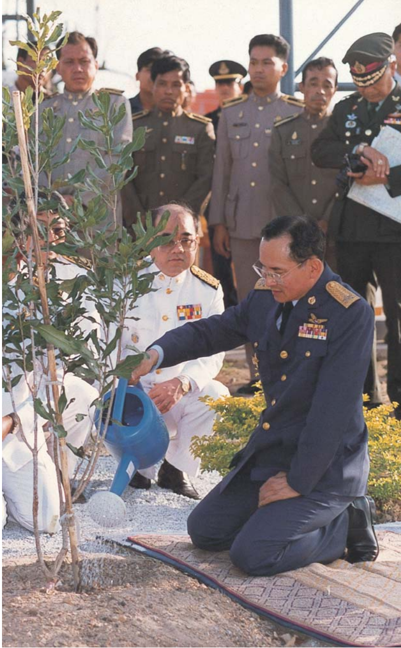
หลักการธรรมา ๒๑